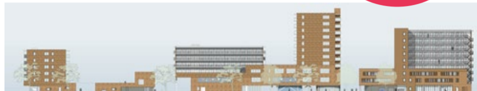
Links het nog te bouwen complex in Corpus den Hoorn. Ontwerp: DAAD Architecten

Op de begane grond van het complex komt kinderdagverblijf 'De Blokkendoos'. De woningen zijn naar verwachting in 2020 gereed. Daarna wordt de omgeving rondom het gebouw aangelegd.