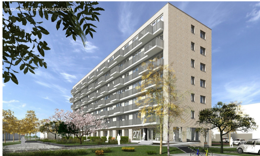
Impressie van Houtenlaan

Op de plek waar tot vorig jaar de zusterflat van het oude Rooms Katholieke Ziekenhuis stond, komt een nieuw gebouw met in totaal 48 woningen. De appartementen aan de Van Houtenlaan in Helpman krijgen twee slaapkamers, een oppervlakte van ca. 60 - 65 m 2 en een eigen berging in de kelder. Als alles volgens planning verloopt, start de bouw dit voorjaar.