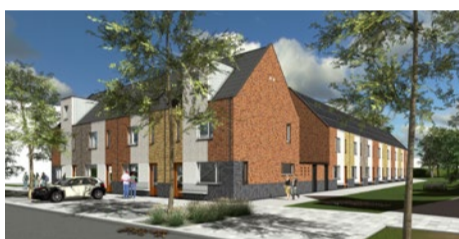
Impressie van de eengezinswoningen in de Grote Beerstraat (ontwerp: ZOFA architecten)

Dit voorjaar wordt gestart met de bouw. De verwachting is dat we de eerste woningen halverwege 2020 opleveren.