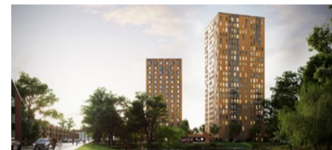
Links woontoren Atlas, rechts Pleione (ontwerp: architectenbureau AAS)

Beide woontorens worden gebouwd zonder gasaansluiting en aangesloten op het warmtenet voor verwarming en warm water. Als alles volgens planning verloopt, start de bouw van de woontorens rond de zomer. Naar verwachting is de bouw twee jaar later afgerond.