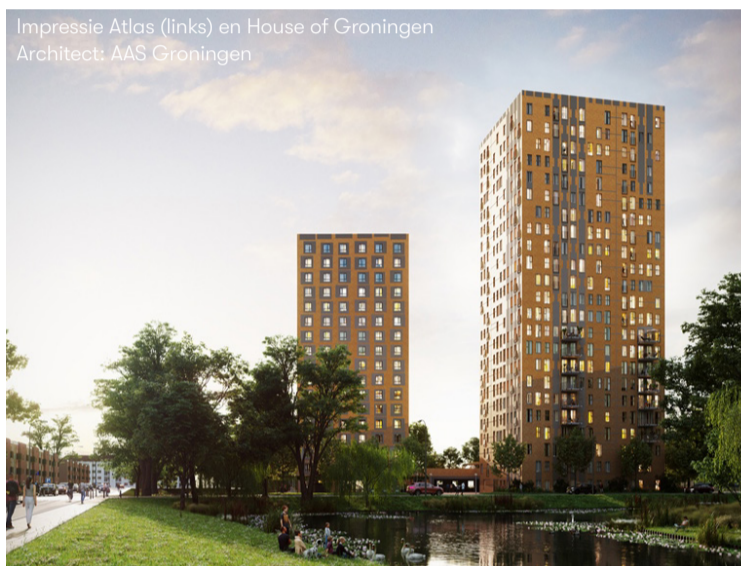
Impressie Atlas (links) en House of Groningen Architect: AAS Groningen

schot water en elektra) zijn circa € 74,50. Het voorschot WarmteStad bedraagt circa € 34. Er kan huurtoeslag worden aangevraagd.