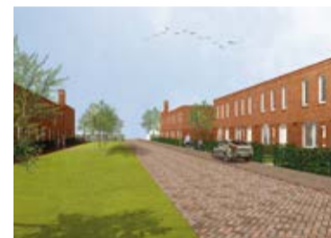
Impressies van de eengezinswoningen. Ontwerp: KAW architecten