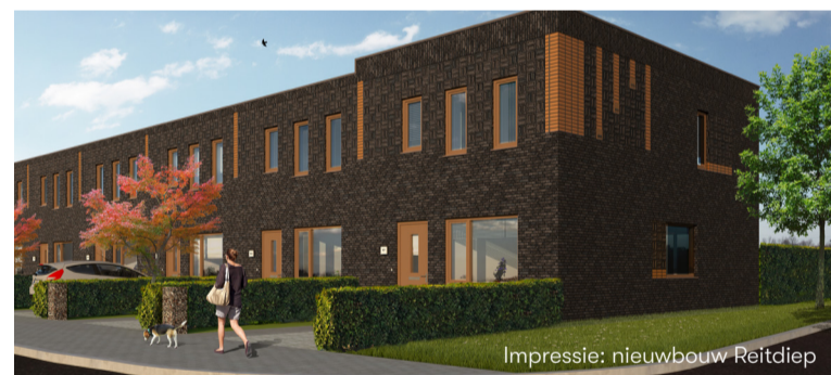
Impressie: nieuwbouw Reitdiep

Het volledige artikel is te lezen op www.nijestee.nl .