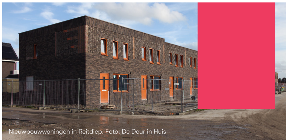
Nieuwbouwwoningen in Reitdiep.