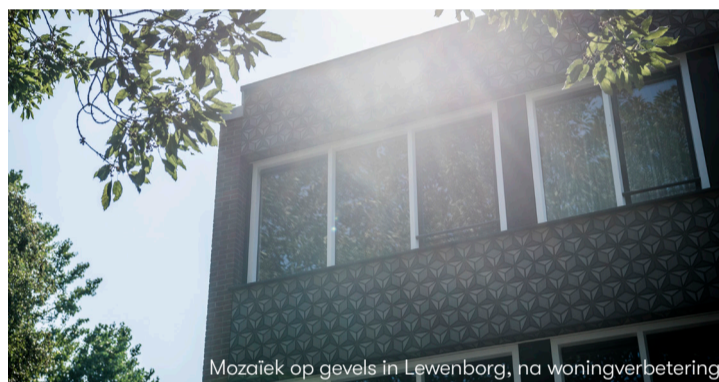
Mozaïek op gevels in Lewenborg, na woningverbetering

Het verbeteren van woningen heeft tot nu toe het gewenste resultaat, maar in de toekomst zijn er meer maatregelen nodig. Om die reden zijn we gestart met het traject: Nieuwe Energie, waarbij we met (nieuwe) partners zoeken naar vernieuwende mogelijkheden om in te investeren. Dit doen we om goede, betaalbare en duurzame woningen voor onze huurders te realiseren, voor nu en in de toekomst!