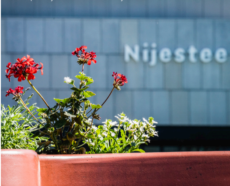
Damsterplein tijdens 'Stad in bloei' in juni 2019