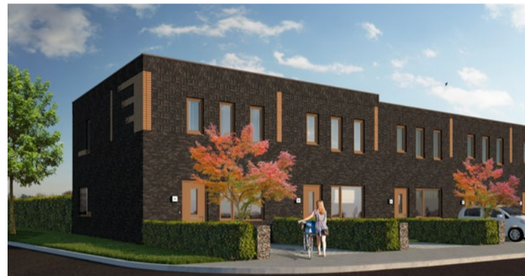
Impressie van de eengezinswoningen. Ontwerp: architectenbureau De Deur In Huis

WoningNet. Om in aanmerking te komen is een inschrijving bij WoningNet noodzakelijk. De huurprijs van de woningen bedraagt rond de € 720,- per maand. De woningen zullen onder de regels van het passend toewijzen worden verhuurd.