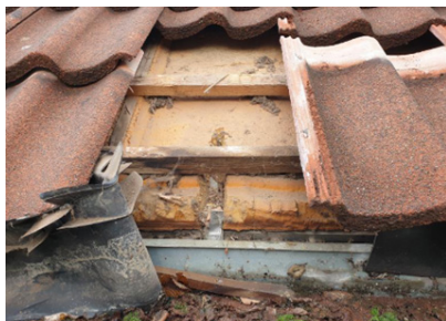
Afbeelding van dakvoet

De dakvoet aan de voor- en achterkant wordt voorzien van nieuwe beplating en panlatten (waar de dakpannen op liggen). Ook wordt de dakgoot vernieuwd.