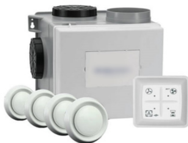
Afbeelding van de ventilatiebox, ventilatieventielen en CO 2 -sensor

De ventilatieventielen zitten in de badkamer, keuken en het toilet. De ventilatiebox wordt vervangen voor een nieuwe ventilatiebox op dezelfde plek. De bestaande ventilatiekanalen worden gereinigd en er worden nieuwe ventielen geplaatst.