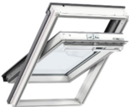
Afbeelding van het nieuwe dakraam

Alle dakramen worden van binnenuit vervangen door Velux dakramen met ventilatierooster.